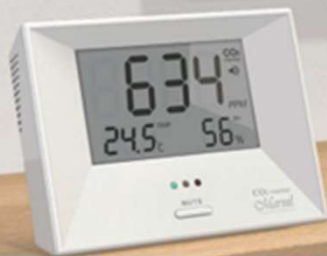
■マーベル 001 / 003

長期間使用時にも、測定誤差の生じにくい 高精度光学式 NDIR デュアルビームセンサーを使用